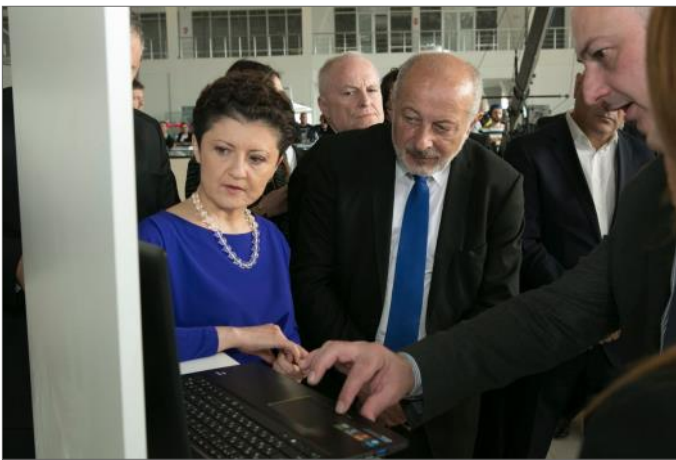
ერთიანი სავაჭრო ქსელის პრეზენტაცია

ღონისძიებას ესწრებოდნენ იუსტიციის მინისტრი თეა წულუკიანი, საქართველოს მთავრობის წევრები, აშშ-ის საერთაშორისო განვითარების სააგენტოს მისიის ხელმძღვანელები, ვაჭრობაში ჩართული სუბიექტების წარმომადგენლები.