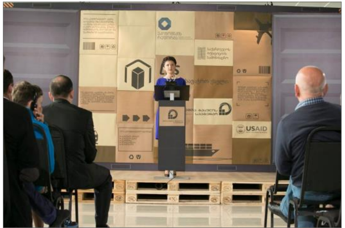
ერთიანი სავაჭრო ქსელის პრეზენტაცია